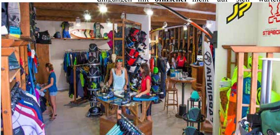
René Egli Megastore mit einer Riesenauswahl an Hardware und Accessoires

Das professionelle Lehrteam bietet Kurse für alle Könnensstufen (ab 8 Jahren) - auf Wunsch als Privatkurs - mit neuestem Material. In kleinen Lerngruppen lässt der Fortschritt nicht auf sich warten.