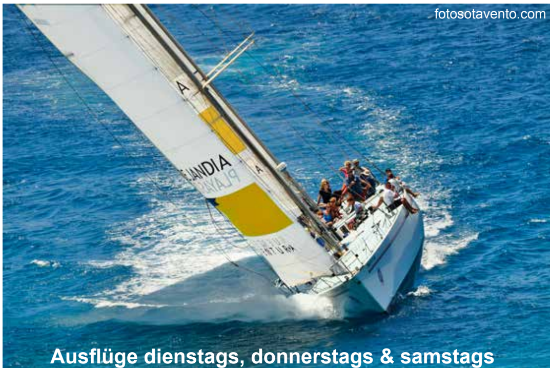
Ausflüge dienstags, donnerstags & samstags

Die rund 3h-stündige Fahrt auf der „Fisher & Paykel“ ist für jeden Segler ein intensives und unvergessliches Erlebnis. Nirgendwo sonst auf der Welt gibt es die Möglichkeit, auf einer der legendären Whitbread-Maxiyachten mitzusegeln, weshalb dieser Segelausflug wohl zu den exklusivsten Aktivitäten gehört, die man auf Fuerteventura machen kann.