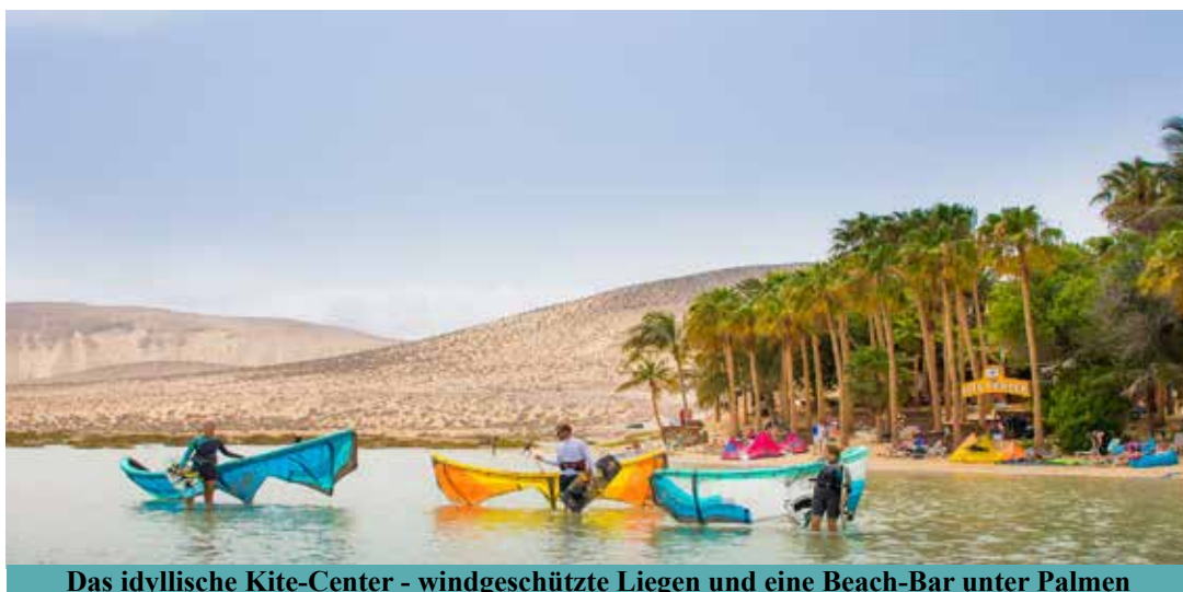
Das idyllische Kite-Center - windgeschützte Liegen und eine Beach-Bar unter Palmen

ragender Windstatistik und der gezeitenabhängigen Lagune optimale natürliche Voraussetzungen.