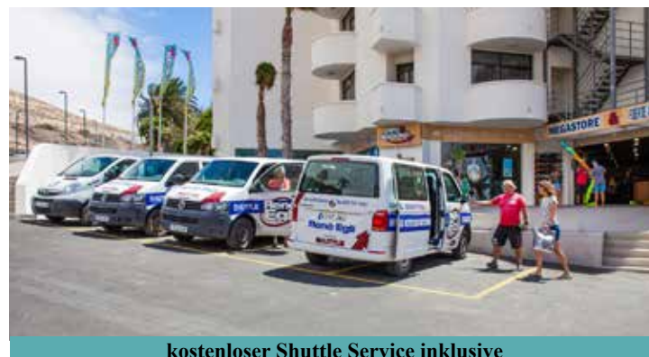
kostenloser Shuttle Service inklusive

Beide Center liegen unmittelbar am Hotel Meliá Fuerteventura (ex Gorriónes) und dem neuen Sol Beach House at Meliá Fuerteventura unter schattenspendenden Palmen. In windgeschützten Liegeoasen kann