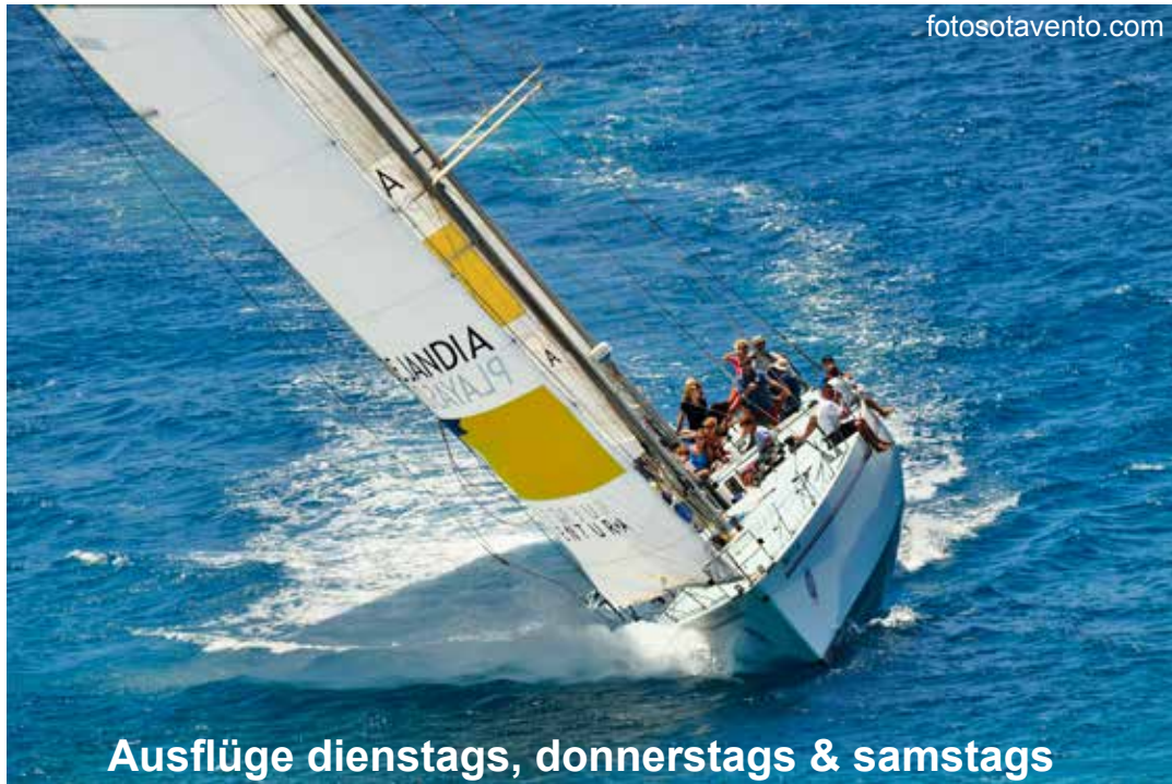
Ausflüge dienstags, donnerstags & samstags

Die rund 3h-stündige Fahrt auf der „Fisher & Paykel“ ist für jeden Segler ein intensives und unvergessliches Erlebnis. Nirgendwo sonst auf der Welt gibt es die Möglichkeit, auf einer der legendären Whitbread-Maxiyachten mitzusegeln, weshalb dieser Sege-lausflug wohl zu den exklusivsten Aktivitäten gehört, die man auf Fuerteventura machen kann.