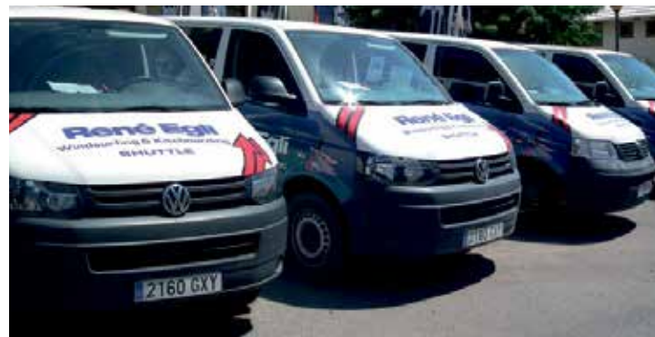
kostenloser Shuttle Service inklusive

Beide Center liegen unmittelbar am Hotel Meliá Fuerteventura (ex Gorriónes) und dem neuen Sol Beach House at Meliá Fuerteventura unter schattenspendenden Palmen. In windgeschützten Liegeoasen kann