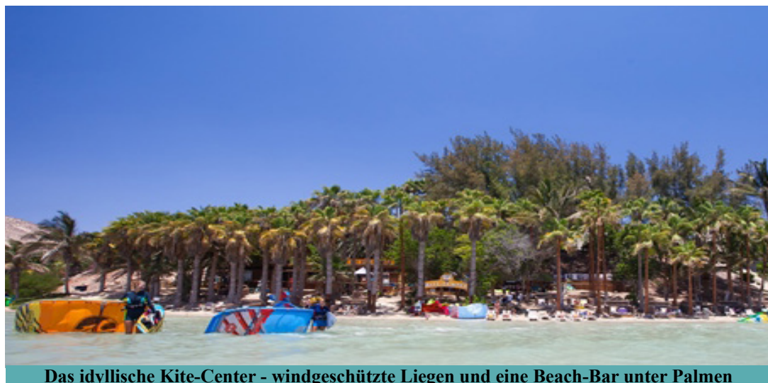
Das idyllische Kite-Center - windgeschützte Liegen und eine Beach-Bar unter Palmen

ragender Windstatistik und der gezeitenabhängigen Lagune optimale natürliche Voraussetzungen.