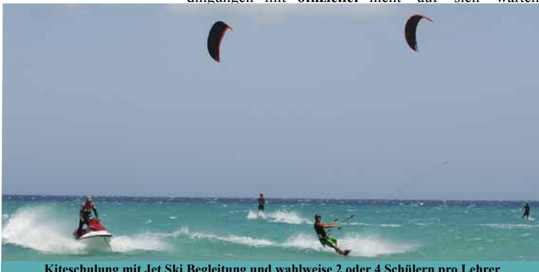
Kiteschulung mit Jet Ski Begleitung und wahlweise 2 oder 4 Schülern pro Lehrer

Das professionelle Lehrteam bietet Kurse für alle Könnensstufen (ab 8 Jahren) - auf Wunsch als Privatkurs - mit neuestem Material. In kleinen Lerngruppen lässt der Fortschritt nicht auf sich warten.