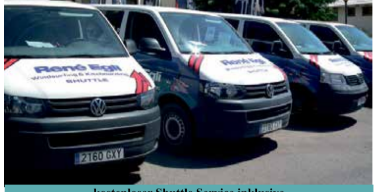
kostenloser Shuttle Service inklusive

Immer am perfekten Spot Beide Center liegen unmittelbar am Hotel Meliá Fuerteventura (ex Gorriones) und dem neuen Sol Beach House at Meliá Fuerteventura unter schattenspendenden Palmen. In windgeschützten Liegeoasen kann