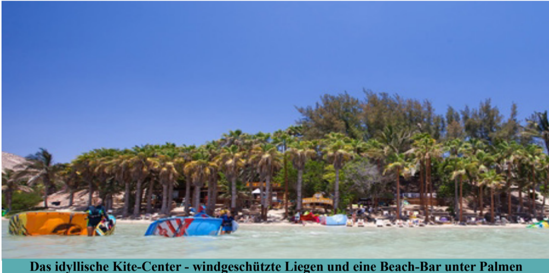
Das idyllische Kite-Center - windgeschützte Liegen und eine Beach-Bar unter Palmen

man herrlich relaxen, die Beach-Bar sowie Süsswasserduchen sorgen für willkommene Erfrischung. Der Spot vor den Centern bietet für alle Level hervorragende Bedingungen. Darüber hinaus ermöglicht der René Egli Lagunenshuttle bei entsprechendem Gezeitenstand einen Transfer an die tiefsten Stellen für Windsurf- und Kitevergnügen im traumhaften Stehvieier. Alle René Egli Kurse werden je nach Bedingungen mit offizieller