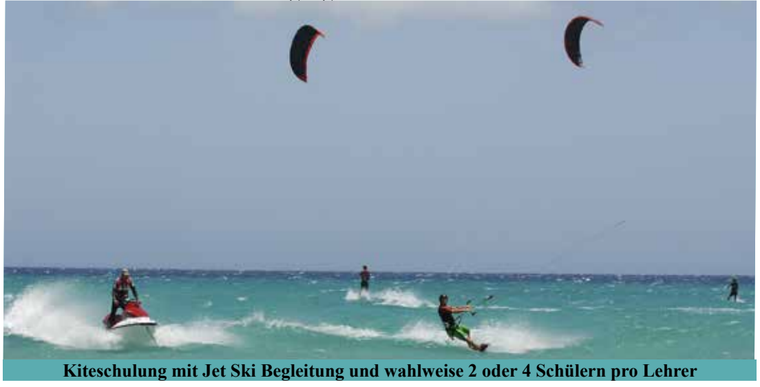
Kiteschulung mit Jet Ski Begleitung und wahlweise 2 oder 4 Schülern pro Lehrer

Das Team sorgt mit seinem ausgebildeten Rescuepersonal für professionelle Sicherheit . Von erhöhten Wachposten aus wird das Geschehen auf dem Meer beobachtet und die Rettung per Jet Ski wird via Funk auf dem Meer koordiniert und bis zum Abschluss überwacht.